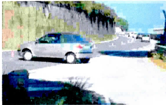
UNA DELLE AUTO "FUORILEGGE" ALL'ALTEZZA DI LETOJANNI

LETOJANNI. Dopo la segnalazione del nostro giornale sulle folli inversioni di marcia sull'A18 nel tratto a doppio senso di marcia all'altezza di Letojanni, Consorzio autostradale e Polizia stradale non hanno perso tempo e si sono subito attivati. Il Cas domenica pomeriggio ha chiuso con dei new jersey l'area parcheggio "Papale est", utilizzata per compiere la manovra e la Stradale di Giardini ha intensificato i controlli ottenendo subito risultati: un automobilista che ha compiuto la pericolosissima manovra di inversione a U, che mette a rischio tutti gli altri conducenti, è stato infatti rintracciato e contravvenzionato ai sensi dell'articolo 176 del Codice della Strada, che prevede una sanzione da 2.006 a 8.025 euro, la revoca della patente ed il fermo amministrativo del veicolo per tre mesi; adesso dovrà "ricominciare" gli studi per conseguire nuovamente il titolo di guida e ritornare su strada da neopatentato. La Polstrada ricorda come ancora più grave sia la sanzione prevista nelle ore notturne, che va da 2.674,67 a 10.700 euro, mentre resta invariata la revoca della patente e il fermo del veicolo. Nei prossimi giorni e fino alla riapertura del tratto interessato dai lavori, i controlli saranno sempre incrementati per garantire maggiore sicurezza.